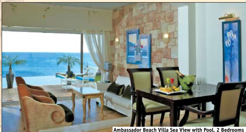
Ambassador Beach Villa Sea View with Pool, 2 Bedrooms

Амбасадор Вилла на Пляже с видом на море и частным подогреваемым бассейном. Мезонетт. Первый этаж: спальня и гостиная/обеденная зона открытого плана, ванная комната, бассейн, терраса. Второй этаж: спальня, гостиная/спальня, две ваннные комнаты, балкон.