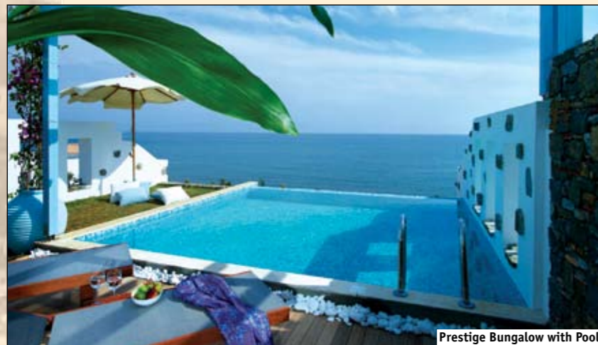
Prestige Bungalow with Pool

ПРЕСТИЖНЫЕ БУНГАЛО: Расположены в отдельных комплексах по 2-3 бунгало.