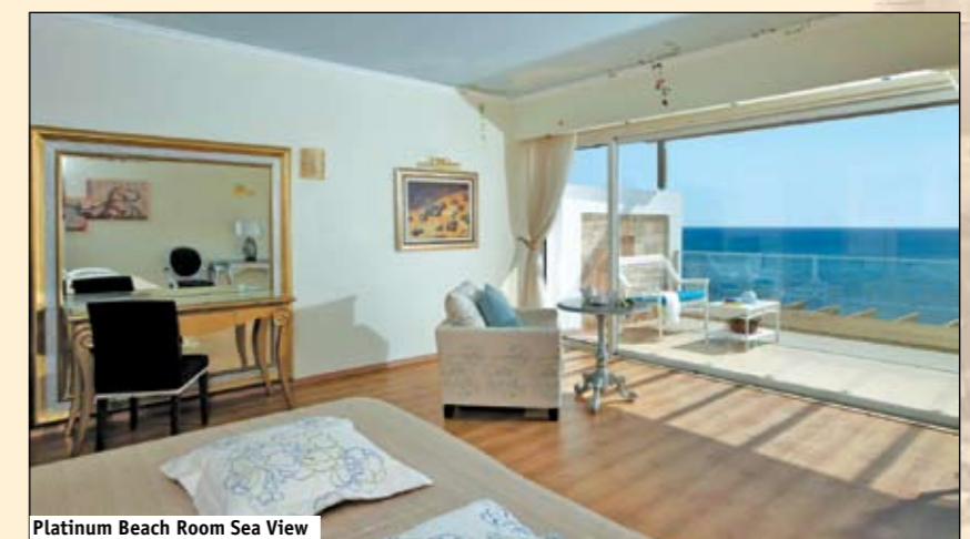
Platinum Beach Room Sea View