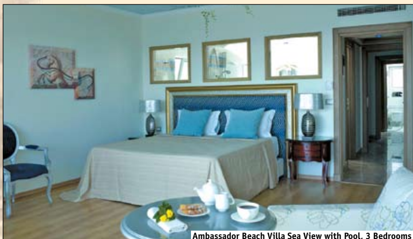
Ambassador Beach Villa Sea View with Pool, 3 Bedrooms

Амбасадор Вилла на Пляже с видом на море и частным подогреваемым бассейном. Мезонетт. Первый этаж: 2 отдельные комнаты – отдельная спальня, спальня и гостиная/обеденная зона открытого плана, ванная комната, бассейн, терраса. Второй этаж: спальня, гостиная/спальня, две ваннные комнаты, балкон.