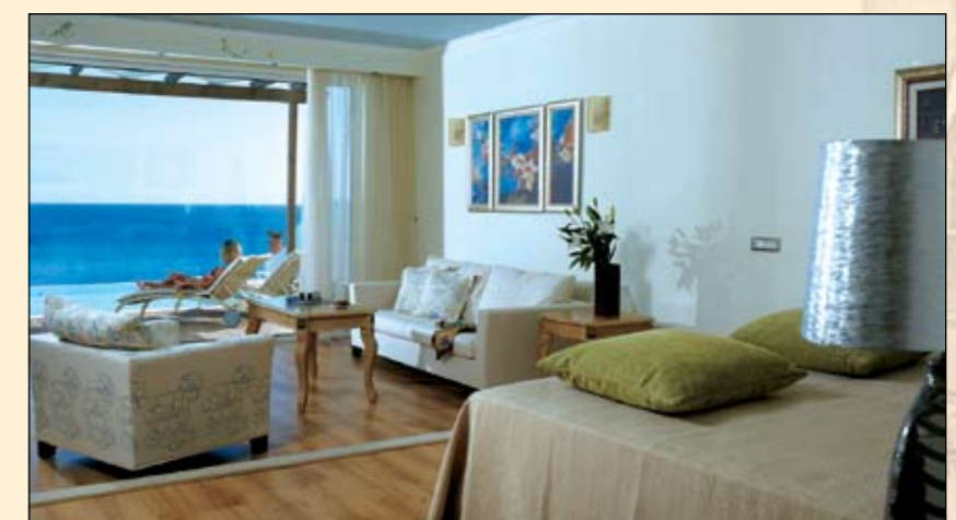
Platinum Beach Junior Suite Sea View with Pool