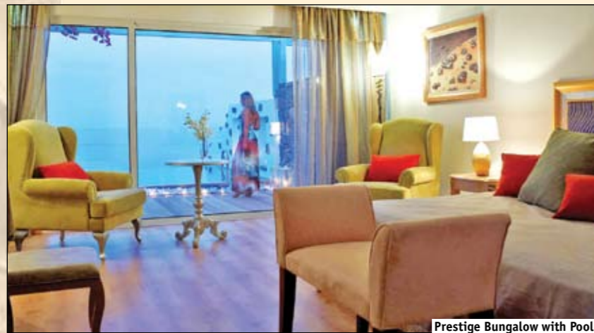
Prestige Bungalow with Pool

27 Deluxe Junior Suite Garden View (5) / Sea View (22) (51 м², 1 комната, max 3 взрослых) Делюкс Джуниор Сьюит с видом в сад или на море. Спальня и гостиная открытого плана, ванная комната с отдельной душевой кабиной.