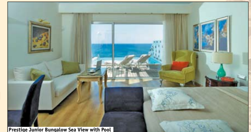
Prestige Junior Bungalow Sea View with Pool