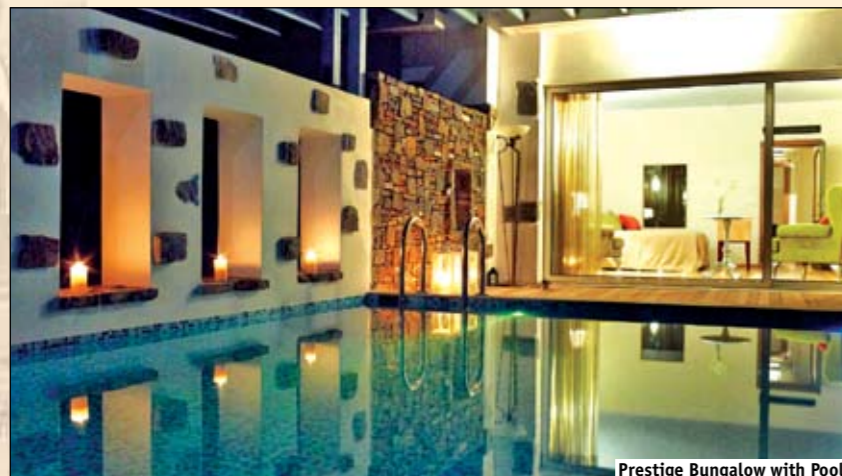
Prestige Bungalow with Pool

4 Prestige Junior Bungalow Sea View with Pool (53 м², 1 комната, max 3 взрослых) Престиж Джуниор Бунгало с видом на море и частным подогреваемым бассейном. Спальня и гостиная открытого плана, ванная комната с отдельной душевой кабиной.